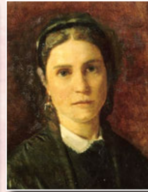
Леоні д'Оне (Біар), друга коханка Гюго

до клініки доктора Ескоріаля, а потім перевели в Сен-Моріс до лікаря Руайє-Коллара. Фахівці поставили йому невиліковний діагноз «набутий ідіотизм». Нині більшість дослідників сходяться на думці, що Ежен насправді страждав на шизофренію.