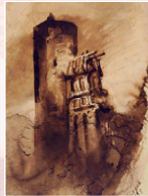
Художні картини митця

«Аделе, мрія прекрасна, вона окрилює, дає сили жити і творити, але горе мрійникові, що дозволяє мрії заповнити себе безроздільно, він приречений на злу долю! Повернись, ми любимо, ми чекаємо на тебе», — писав їй батько. Проте донька вважала себе цілком щасливою, адже збулися її мрії: вона поряд із коханим. Тричі вона обіцяла приїхати, але не дотримала слова. «Хай лишень повернеться, — останнє я беру на себе. Вона все забуде, вона одужає, — занотував Гюго у щоденнику. — Я увінчаю нею свою старість. Прославлю її вигнання, відшкодную їй усе. А потім, коли вона зцілиться і повеселішає, ми видамо її заміж за гідну людину».