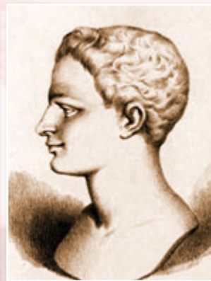
Ежен Гюго, брат письменника

Періодично вона вдавалася до спроб примирення із чоловіком — узявши дітей, через охоплені війною землі сміливо приїжджала без попередження на місце його служби, вимагала грошей. Леопольд уже був, м'яко кажучи, не надто радий таким відвідинам. Дізнавшись про стосунки дружини зі зрадником Лагорі, він одного разу під час нападу люти вигнав Софі батогом надвір серед ночі, конфіскував її будинок у Парижі, вивіз звідти всі речі, позбавив батьківських прав і віддав дітей до закритого пансіону. «Прикро усвідомлювати, що батько грабує самого себе і свою родину заради жінки, — писала Софі синові. — Тепер ти розумієш, до чого здатні привести безпринципність і потурання власним пристрастям».