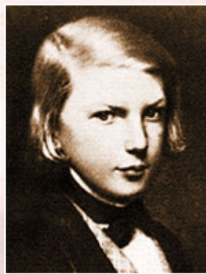
Віктор Гюго, дитячі роки