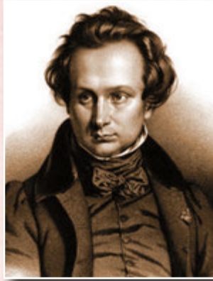
Віктор Гюго в молоді роки, 1851 р.