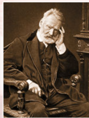
Віктор Гюго у зрілому віці, 1883 р.

на рік на свята. Попри це, пристрасна натура Гюго не знала спокою, і того ж року він завів собі нову коханку. Відважна мандрівниця Леоні д'Оне була на 18 років молодшою за нього і до того ж дружиною художника Франсуа-Огюста Біара і матір'ю двох дітей. Тому їхні стосунки досить скоро призвели до скандалу: за намовою обманутого чоловіка, коханців на знятій квартирі викрила поліція «під час осудливої розмови у зім'ятому одязі», історія потрапила до преси. Віктор на той час уже був пером Франції, віконтом, а отже, недоторканим. А Леоні довелося відбути дво-місячне ув'язнення у тюрмі Сен-Лазар і після цього жити у монастирі. Закінчилося все втручанням короля, відкликаним позовом і розлученням подружжя Біар. Після виходу з монастиря Леоні стала частою гостею в помешканні Гюго і подружилася з Аделлю, яка нібито у такий спосіб намагалася помститися Жульетті.