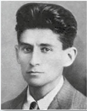
Франц Кафка в молоді роки