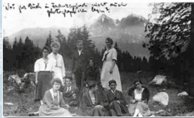
Кафка в санаторії