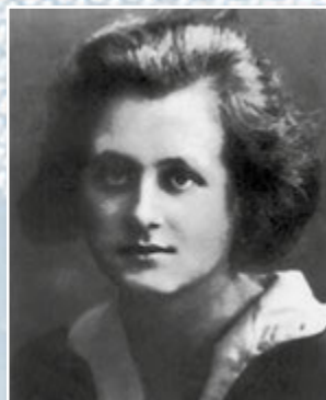
Мілена Єсенська, найбільша пристрась Кафки