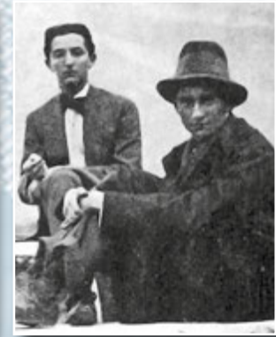
Макс Брод і Франц Кафка

На думку психоаналітиків, це є класичною ознакою психології дитини: невротична свідомість лише фіксує наявність страждання, але не усвідомлює його причин і не бачить засобів усунення. Біографи ж схильні вбачати у подібних записах «людини з надто великою тінню» (як називав сам себе Франц) ознаки психастенії функціонального характеру.