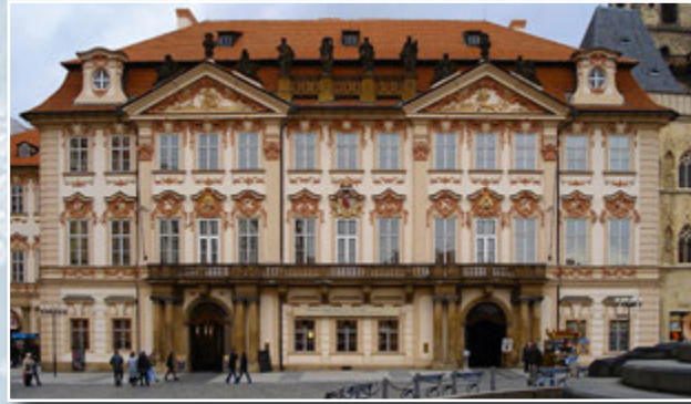
Дім, де знаходилася гімназія, яку закінчив Кафка, а пізніше — магазин його батька