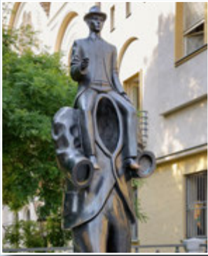
Пам'ятник Францу Кафці (Прага)