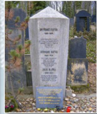
Могила Кафки на Новому сврейському кладовищі

зважився залишити ненависну Прагу й оселитися з коханою в Берліні. Попри хворобу, останні десять місяців свого життя Франц прожив мирно і щасливо — разом із Дорою, яка всіма силами оберігала його письменницький спокій, але так і не стала його дружиною.