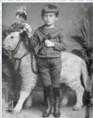
Кафка в дитинстві