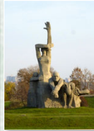
Меморіал розстріляним у Зміївській балці

з причин називають їхні розбіжності у політичних поглядах (зокрема, симпатії першого до сіоністів, а другого — до нацистів). У популярній літературі усталася думка, що це саме Сабіна посварила двох великих науковців. Біограф С. Ріхебехер із цього приводу зазначає: «Динаміка стосунків між Фройдом, Юнгом і Шпільрейном більше не була протистоянням двох чоловіків, суперників між собою, які врівноважують своє суперництво завдяки третій стороні, як 1909 р. Тепер кожен намагався по-своєму у тліючому конфлікті залучити її на свій бік». Сабіна, яка спочатку належала до юнгіанського табору, згодом перейшла до фройдівського, не розірвавши при цьому стосунків із попереднім. Вона підтримувала листування з обома науковцями — принаймні до 1923 р., про що свідчить її женецький архів.