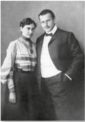
Карл Юнг із дружиною Еммою, 1903 р.