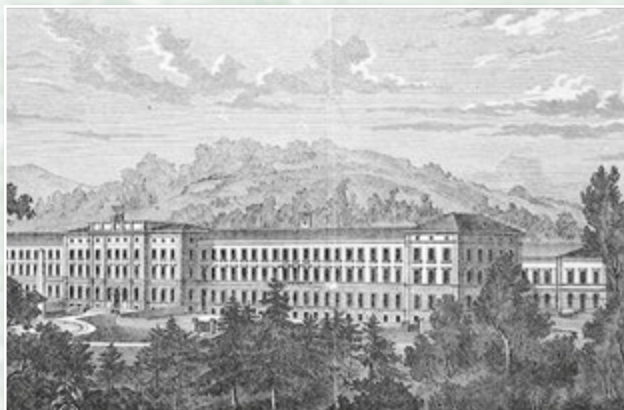
Клініка Бурггольцлі, кінець XIX ст.