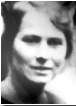
Сабіна Шпільрейн, 1920-ті рр.