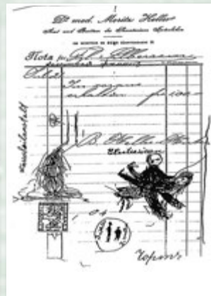
Рецепт доктора Морітца з малюнками Сабіни