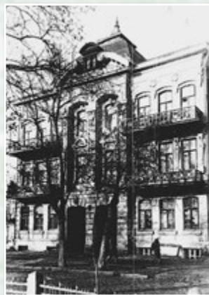
Дім родини Шпільрейн у Ростові-на-Дону